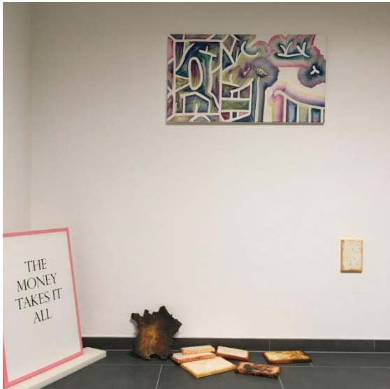
Ausstellungsansicht Discofan in DIE BOX

Wenn wir Bilder der Kunst betrachten, erzeugt diese bei jedem von uns ganz eigene Bilder. Sie macht etwas mit uns. Bringt uns in Diskussion. Hier knüpft Kunsttherapie an und bedient sich dieser individuellen Bilderketten. Jene sind komplex und überlisten so manches Mal unseren rationalen Verstand. Sie beruhigen uns oder regen uns auf. In jedem Fall sind sie Impuls gebend.