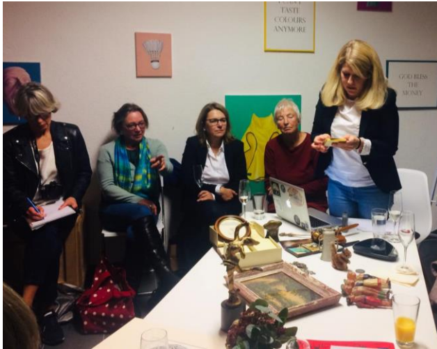
Ist das Kunst oder kann das weg? Am 5.11.19 (J. Teek)

MIXED ART Ist das Kunst oder kann das weg? Ein Schätzabend und Mini-Auktion mit Lena Berkler Di, 07.04. | 19 Uhr | TN-Gebühr 5 € | Bitte bringen Sie ein Objekt zum Schätzen und/oder Versteigern mit.